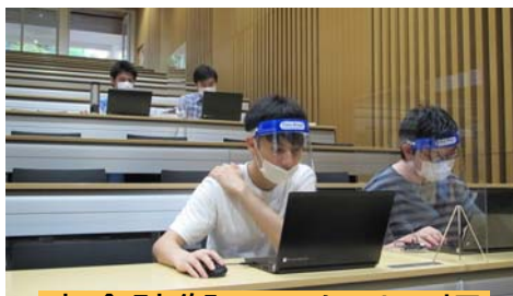
完全防御&アクリル板