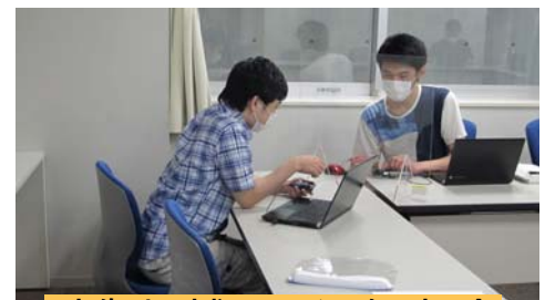
防御板越しに通信実験