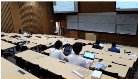
広い会場でもばらに参加