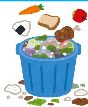
しょうしゆうざい 消臭剤