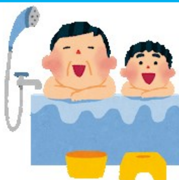
にゆうよくざい 入浴剤